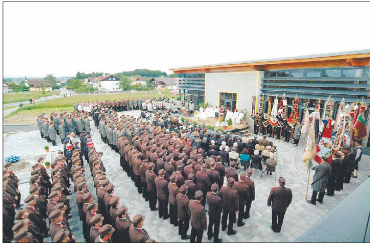
Göming feierte das neue Gemeindezentrum mit einem Festakt.

Seit dem Jahr 2000 wurde stetig daran gearbeitet. Die Planungsgruppe sammelte bei Exkursionen Eindrücke über vorbildhaft (um)gebaute Gemeindeämter, die mit der Bevölkerung diskutiert wurden. 2003 kürte ei-