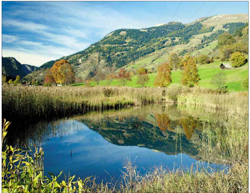
Die Naturschönheiten von Dorfgastein können ab 2008 auf einem Erlebnis-Wanderweg entdeckt werden.

Familienfreundlich und barrierefrei: Diese beiden Grundsätze zählen zu den Hauptanforderungen an den Rundweg, der sich je nach Route über 1,2 bis zu 2 Kilometer Länge erstrecken wird. Bei interaktiven Stationen werden die Wanderer – von Jung