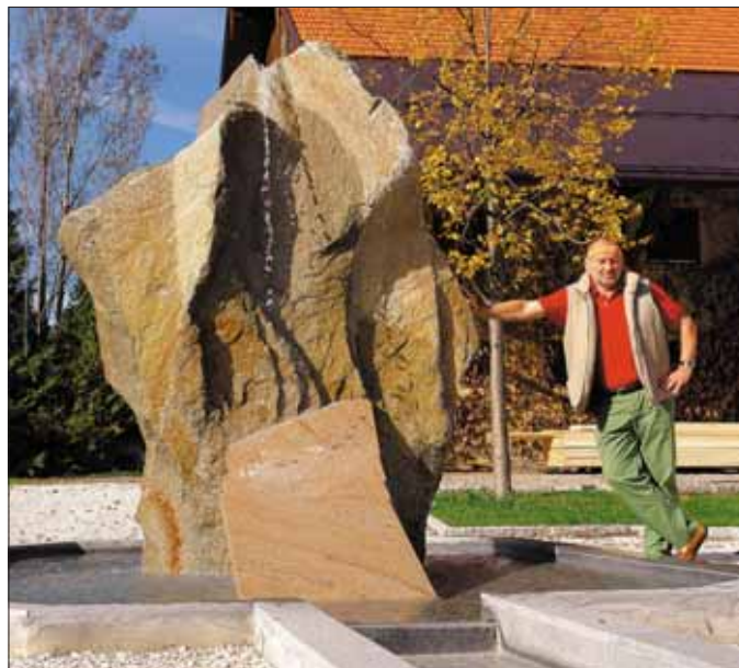
Der von Künstler Peter Mairinger geschaffene Brunnen ist nicht nur eine wertvolle Bereicherung für das Gemeindezentrum, sondern auch für den Pilgerweg „Via Nova“. Dieser Weg führt von Metten in Bayern nach St. Wolfgang.

Planung, Entwurf, Materialbeschaffung und Bearbeitung wurden im Rahmen des Projektes „crafts“ von der Europäischen Union und vom Land Salzburg finanziert, die Fertigstellung konnte durch die Mittel der Gemeinde ermöglicht werden. Wasser ist gesund, Wasser ist Leben: Der Brunnen wird so zum idealen Symbol für das Seehamer Gemeindezentrum.