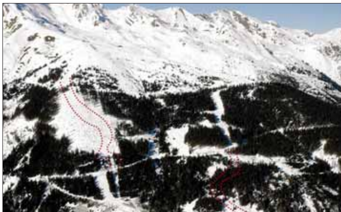
Die geplanten neuen Abfahrten sollen die Skifahrerströme besser verteilen.

Im Kernsgebiet Schlossalm – Angertal-Stubnerkogel sind an Spitzentagen bis zu 12.000 Wintersportler unterwegs. „Da kommt es in der Hochsaison