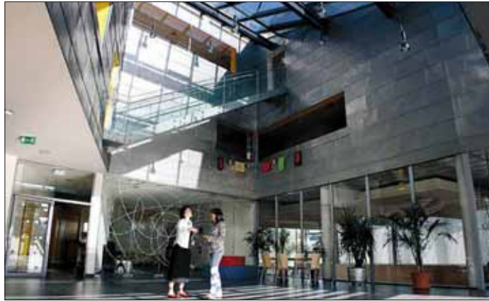
Hallein: Das Sonderpädagogische Zentrum wurde mit dem Architekturpreis des Landes Salzburg ausgezeichnet.

Zwei wesentliche Aspekte überzeugen beim Preisträgerprojekt von „kadawittfeldarchitektur“: Zum einen die selbstbewusste architektonische Haltung des Baukörpers im Umfeld der Stadt Hallein (in unmittelbarer Nähe von Auswüchsen anheimelnden