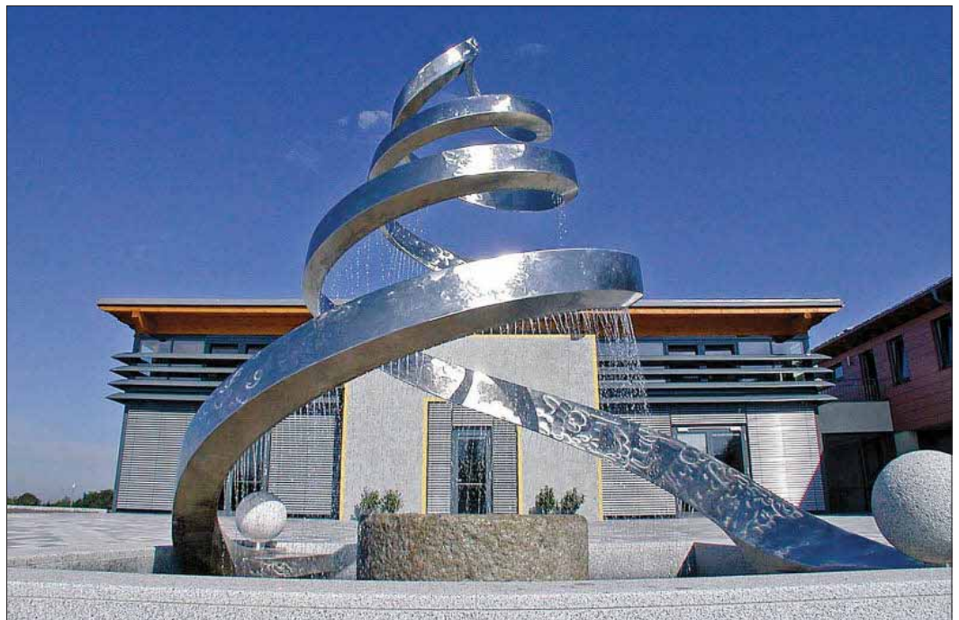
Ein echter Blickfang – der futuristische Brunnen im Zentrum der Gemeinde Göming.