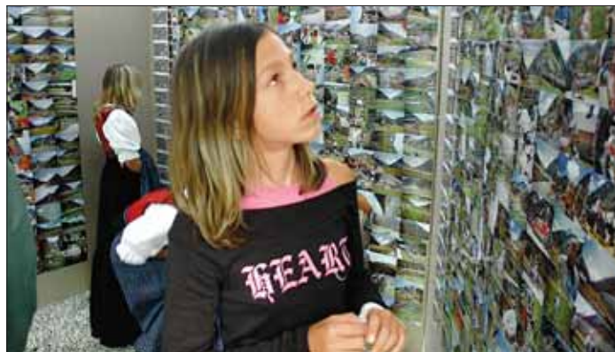
Die Fotos konnten im Rahmen einer Ausstellung betrachtet werden.

Beim Fotowettbewerb „Impressionen in Krimml“ ist nun auch die fotografische Kreativität der Erwachsenen gefragt. Bis zum 20. April 2007 haben Amateurfotografen, Profi-Fotografen, Bildjournalisten, Kinder und Studenten Zeit, auf Bildmotiv-Suche zu gehen. Beurteilungskriterien sind der Bezug zu Krimml und zum Nationalpark Hohe Tauern, die Gestaltung sowie die Ausarbeitung, Präsentation und Qualität. Die Preise wer-