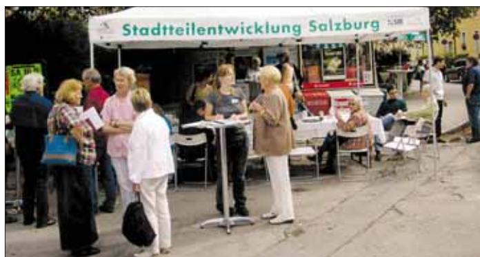
Parsch frühstückt gemeinsam: An gut frequentierten Stellen des Stadtteils wurde im Herbst an vier Vormittagen der Frühstückstisch gedeckt.

Eine historisch wertvolle Fotodokumentation von Maxi Schönberger rundete den Abend ab. Interessant war auch der gewählte Veranstaltungsraum: Im Borromäus-Point sind eine Bäckerei, Apotheke, ein Blumen- und ein italienischer Delikatessenladen zu finden.