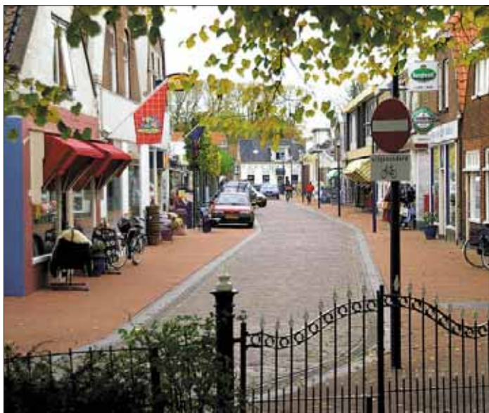
Die niederländische Gemeinde Koudum gewinnt den diesjährigen Europäischen Dorferneuerungspreis.