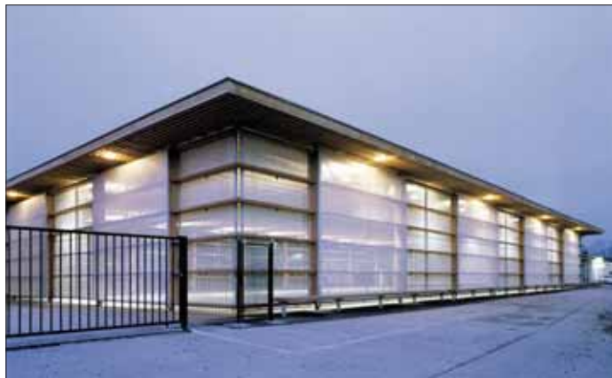
Bergheim: Die preisgekrönte Überdachung des Eislaufplatzes.