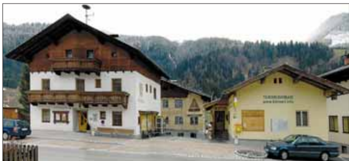
So präsentiert sich Kleinarl derzeit: links das Gemeindeamt, rechts das Tourismusbüro. Das soll sich bald ändern!