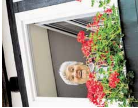
Ziel: So lange wie möglich zu Hause bleiben.

in den beiden Gemeinden der letzten Jahre umge-