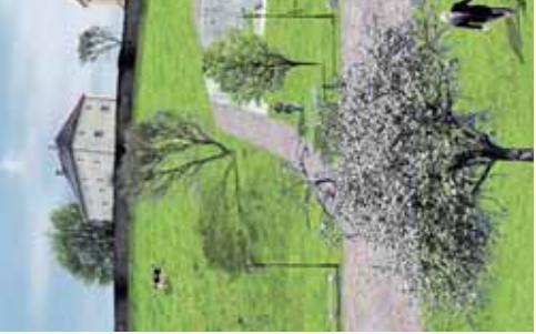
Bergheim 2.0: So könnte das