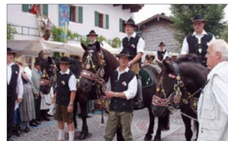
Vierter Preis für den Tourismusverband Bad Vigaun und sein diesjähriges Bauernherbstfest, das am Dirndlgwandlsonntag über die Bühne ging. Fast alle Besucher sind in Tracht gekommen, der Dorfplatz war aufwändig geschmückt.