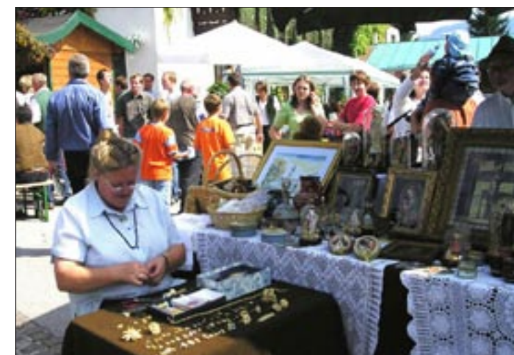
Vierter Preis für den Tourismusverband Faistenau und sein Bauernherbstjubiläumsfest. Dabei ist es hervorragend gelungen, viele engagierte Bevölkerungsgruppen aus der Gemeinde und aus der Region einzubinden.