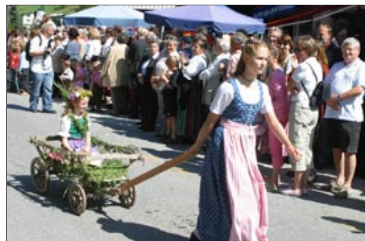
Erster Preis für den Tourismusverband Filzmoos und sein Eröffnungsfest zum 10. Bauernherbst. Höhepunkte waren der Festumzug zum Thema „Holz und Heu“, der Aufmarsch der Vereine, die Bauernhochzeit und die Handwerksvorführungen.

Zum siebten Mal wurde heuer der Bauernherbst-Wettbewerb von der „Gemeindeentwicklung Salzburg“ gemeinsam mit Raiffeisen Salzburg durchgeführt. Sponsoren bzw. Partner waren neben den Abteilungen des Landes für Tourismus und Wirtschaft, Land- und Forstwirtschaft und Salzburger Volkskultur das Familienreferat, Akzente Salzburg, Pro Holz und die Stieglbrauerei.