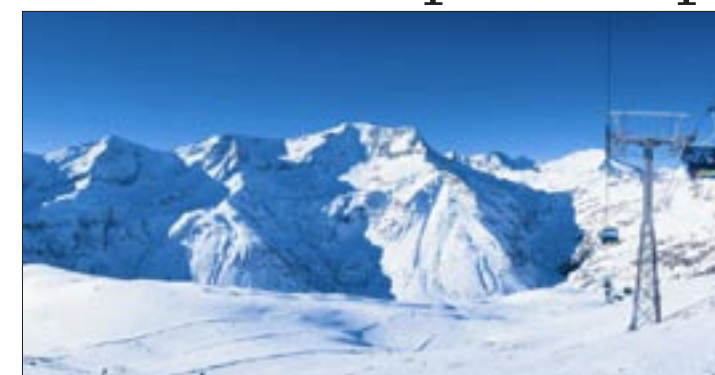
Optimale Schneebedingungen im Skigebiet in Sportgastein sind mit der neuen Schneeanlage garantiert.

Das wasser- und naturschutzrechtlich bewilligte Gesamtprojekt umfasst Schneeflächen von der Bergbis zur Talstation in einer Größenordnung von rund 34 Hektar. Es soll in