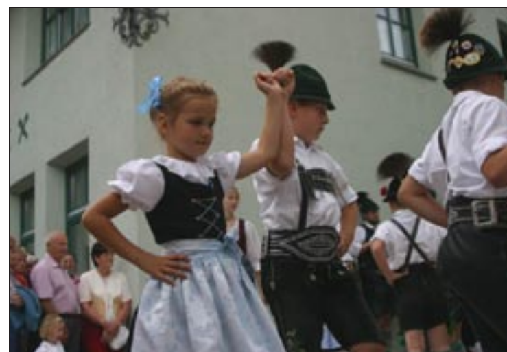
Dritter Preis für den Tourismusverband Salzburger Saalachtal für sein Bauernherbstfest mit Almabtrieb, das in St. Martin bei Lofer stattfand. Geboten wurde ein bunter Aktivitätsreigen mit vielen kreativen Ansätzen.