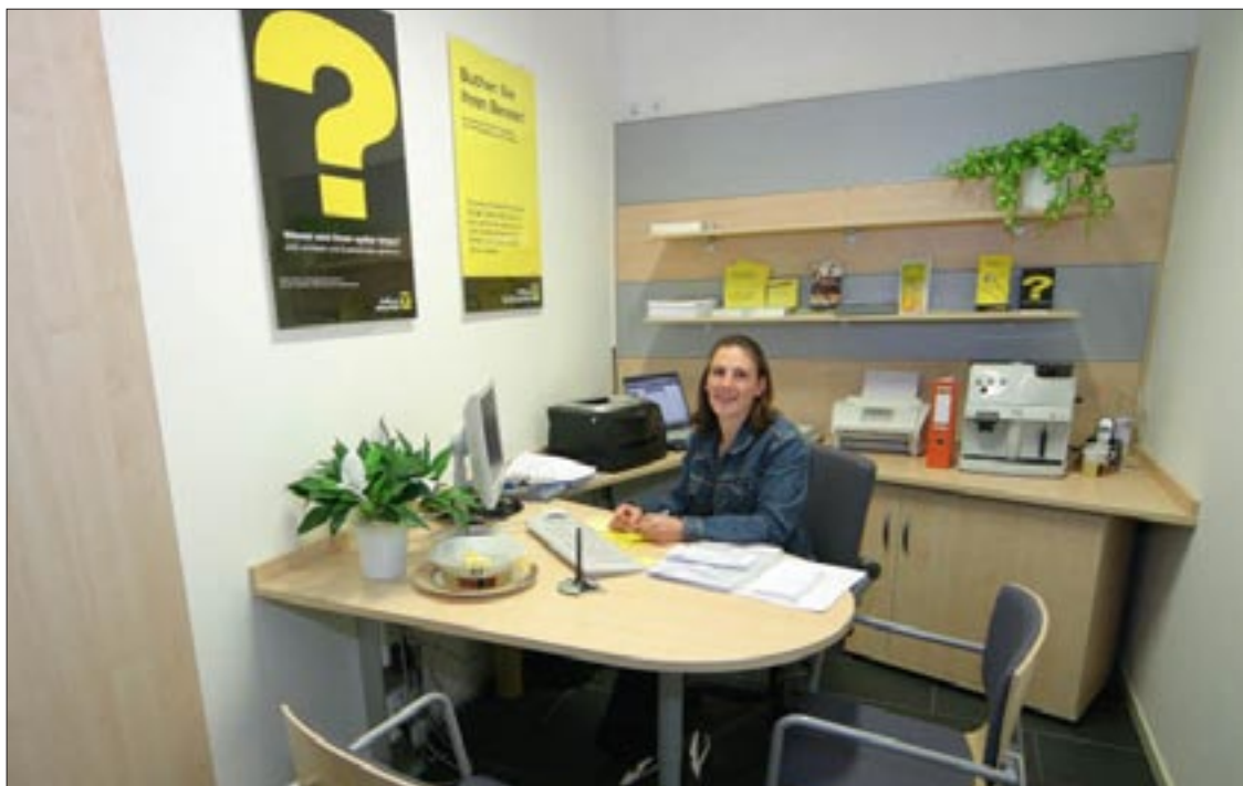
Ein Blick in die neue Raiffeisen-Bankstelle in der Fachhochschule Puch/Urstein.

Gebucht wird die Beratung online auf www.rvs.at/fh unter „Be-