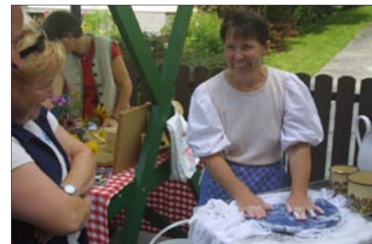
Zweiter Preis für den Tourismusverband Taxenbach und seine Bauernherbst-Eröffnungsfest. Die gesamte Ferienregion Nationalpark Hohe Tauern war ins Geschehen mit eingebunden.