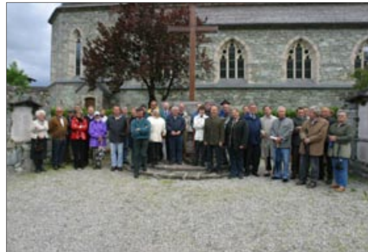
Erfolg für die Mitglieder des Arbeitskreises „Gemeindeentwicklung“: In Bruck wird endlich der Dorfplatz neu gestaltet.

Während der Prozess im Ortsteil St. Georgen fast abgeschlossen ist, steht man in Bruck in den Startlöchern. Dabei besonders bemerkenswert: In Bruck zeichnet sich der Prozess durch eine hohe Bürgerbeteiligung aus. Zahlreiche interessierte Brucker holten sich im Rahmen einer Exkursion in