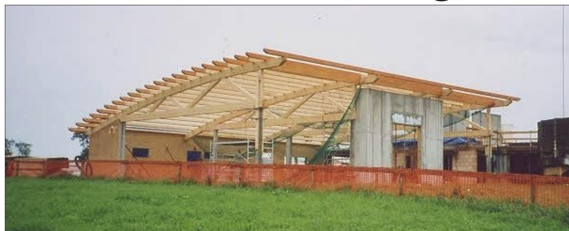
Baufortschritt in rekordverdächtigem Tempo. Spatenstich war im Juli, Firstfeier am 20. Oktober.