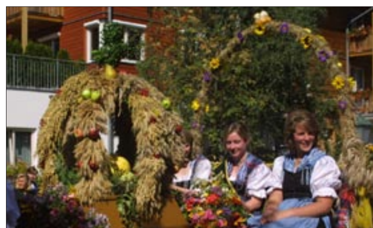
Den Sonderpreis „Jugend“ , gesponsert von „Akzente Salzburg“, erhielt die Landjugend Gastein für den Erntedankumzug. Gewürdigt wurde das enorme Engagement der Jugendlichen, die diese Veranstaltung perfekt organisiert haben.