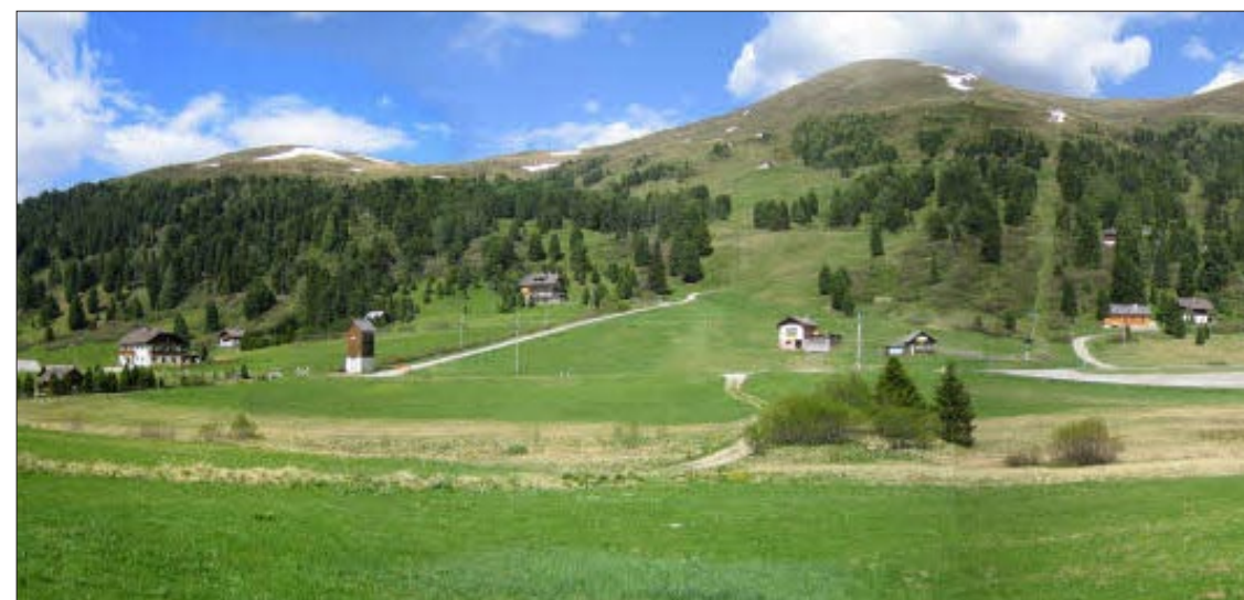
Im Schönfeld soll mit dem Jugend- und Familiengästehaus ein neues Zentrum entstehen.

Seit die Gemeinde Thomatal von der Gemeindeentwicklung Salzburg begleitet wird, ist das wirtschaftliche Überleben des Ortsteiles „Schönfeld“ vorrangiges Thema. Das erarbeitete Tourismuskonzept und die Kanalisierung sind abgeschlossen und stellen ebenfalls Grundlagen für eine mögliche Weiterentwicklung dar. Das „Juwel“ maßvoll zu schleifen, es dabei nicht zu zerstören, sondern es zum wertvollen „Schmuckstück“ werden zu lassen: Das ist die große Aufga-