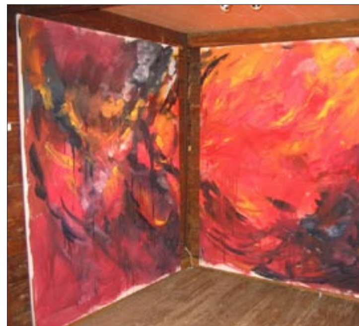
Beeindruckende Kunstausstellung im Sigl-Haus in St. Georgen.

In Riedersbach ist Kunst ohne wissenschaftliche Erklärungen von Kunstexperten einfach da, wie ein Nervenstrang durchzieht sie den gewaltigen Organismus Kraftwerk. Im Sigl-Haus wurden die Werke der aus Österreich delegierten Kunstschaffenden präsentiert und im Rendl-Haus wurde der „Georg Rendl Park“ mit den Arbeiten des „Lignum Holzsymposiums 2005“ eröffnet. Auch das nach dem Hochwasser renovierte Rendl-Haus wurde den Besuchern vorgestellt. Nach St. Pantaleon, St. Georgen und St. Radegund wanderte die Ausstellung nach Triest – eine Grenzüberschreitung im wahrsten Sinne des Wortes!