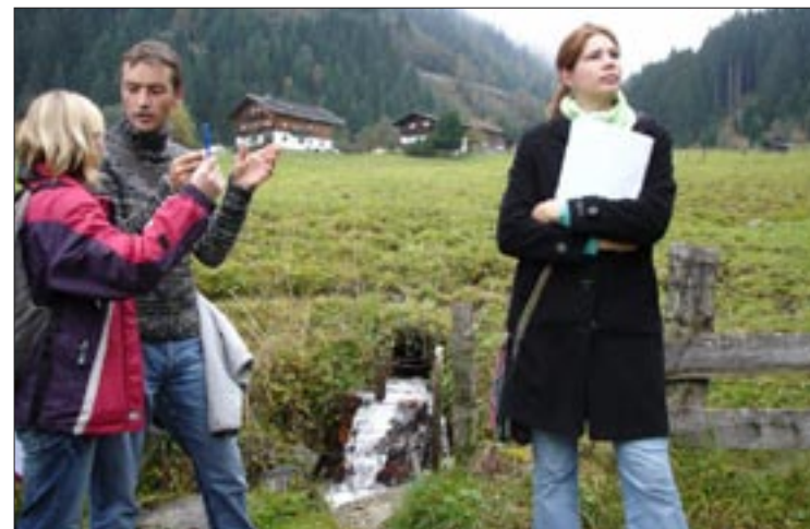
Universitäts-Lehrveranstaltungen setzen sich mit Tourismus-Impulsen für die Gemeinde Krimml auseinander.