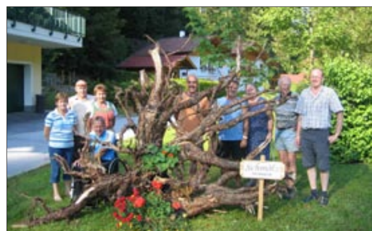
Vierter Preis für die Gebrüder Gamsjäger aus Mühlbach am Hochkönig für „Fest verwurzelt“. Im Mittelpunkt standen gekonnt arrangierte, riesengroße Wurzelstöcke, die im Ortsgebiet ausgestellt wurden, und ein „Fest am Berg“.