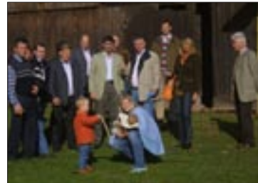
Die Exkursionsteilnehmer beim Schmiedbauerngehöft in Seeham.

Nächstes Ziel der Hallwanger Exkursionsteilnehmer war das Schmiedbauerngehöft in der Gemeinde Seeham. Das Schmiedbauerngehöft gehört zu den wenigen alten Objekten, die in Seeham noch erhalten geblieben sind. Dort soll ein Gemeinde-