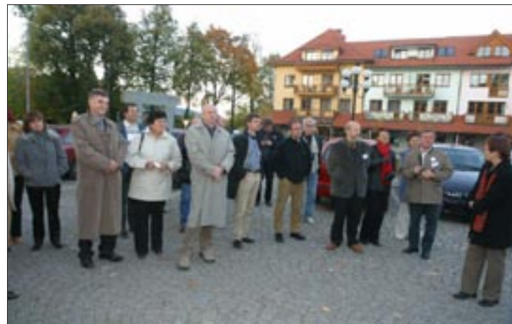
Europäische Schulen der Dorferneuerung tagten in Brandenburg.

Die Aufstellung und Umsetzung von Konzepten zur integrierten ländlichen Entwicklung spielt zurzeit überall in Europa eine wichtige Rolle. So ist die