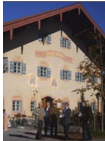
Das bayerische Wirtshaus D'Feldwies lockt nicht nur mit hervorragenden Speisen, sondern beeindruckt auch durch die gelungene Fassadengestaltung.