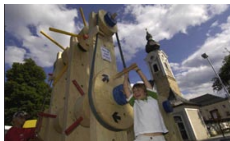
Den Sonderpreis „Familienfreundliches Fest“ , gesponsert vom Familienreferat, sowie den Sonderpreis „Holz“ von „proHolz“ erhielt der Tourismusverband Altemarkt für „S'klappernde Fest!“.