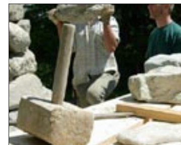
Im Bild die Werkzeuge des Künstlers.

Der Entwurf greift eine historische Form der Wegmarkierung