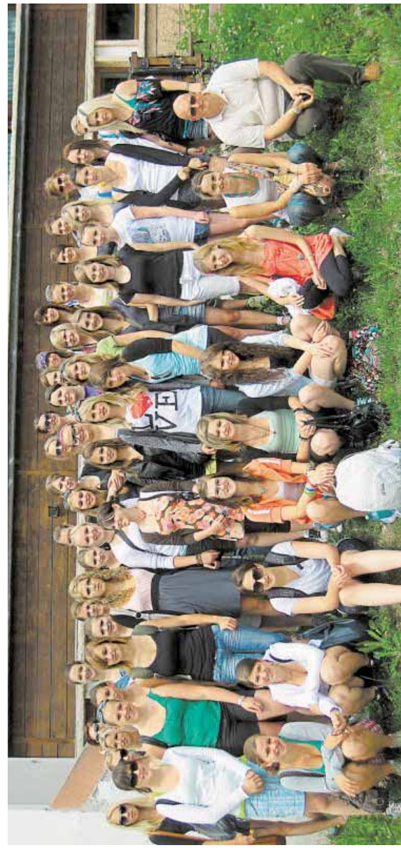
Mit einem Doppeldeckerbus reisten Südtirol und Belluno.