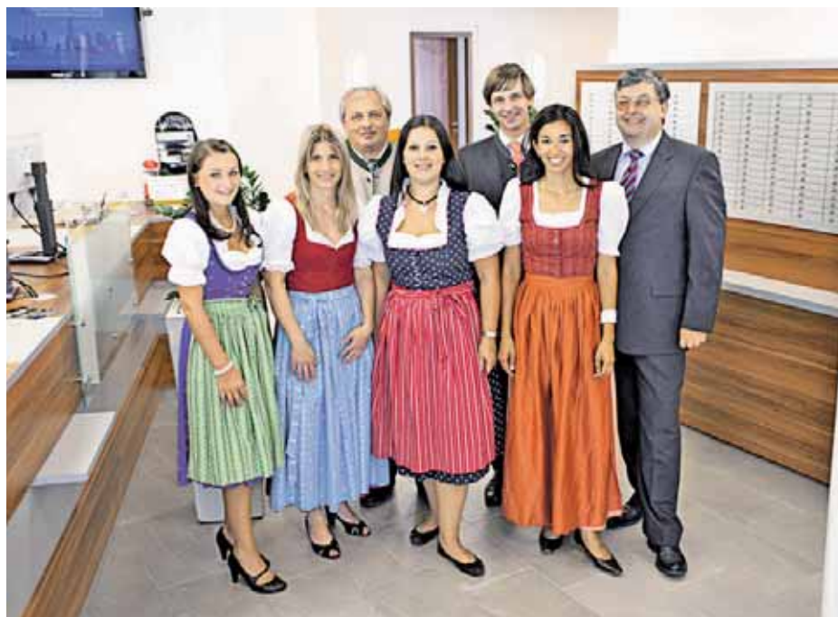
Mit modernster Technik und vertrauten Mitarbeitern bleibt Raiffeisen in Gnigl dem Image als Bank vor Ort auch weiterhin treu.

ternehmen auch in Zukunft auf die große Nachfrage nach erstklassiger Vermögensberatung reagieren.