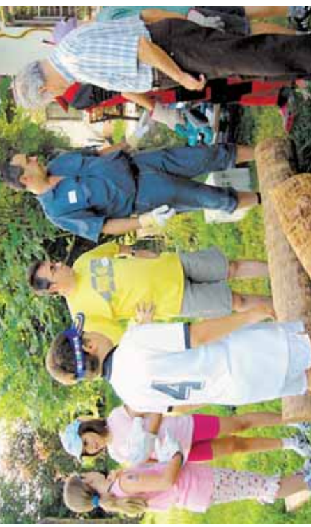
Generationsübergreifender Workshop in St. Georgen.

Im Jänner wird eine Schulung zum Thema „Barrierefreiheit