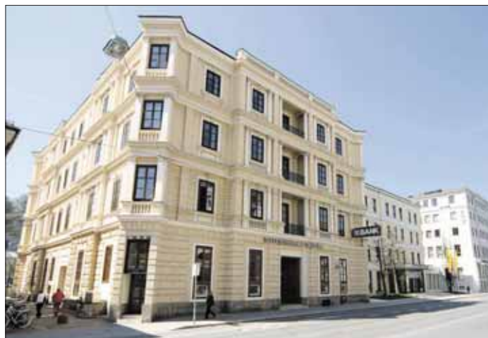
Raiffeisen ist weiter unumstrittener Marktführer in Salzburg. Im Bild die Zentrale des Raiffeisenverbandes Salzburg in der Schwarzstraße.