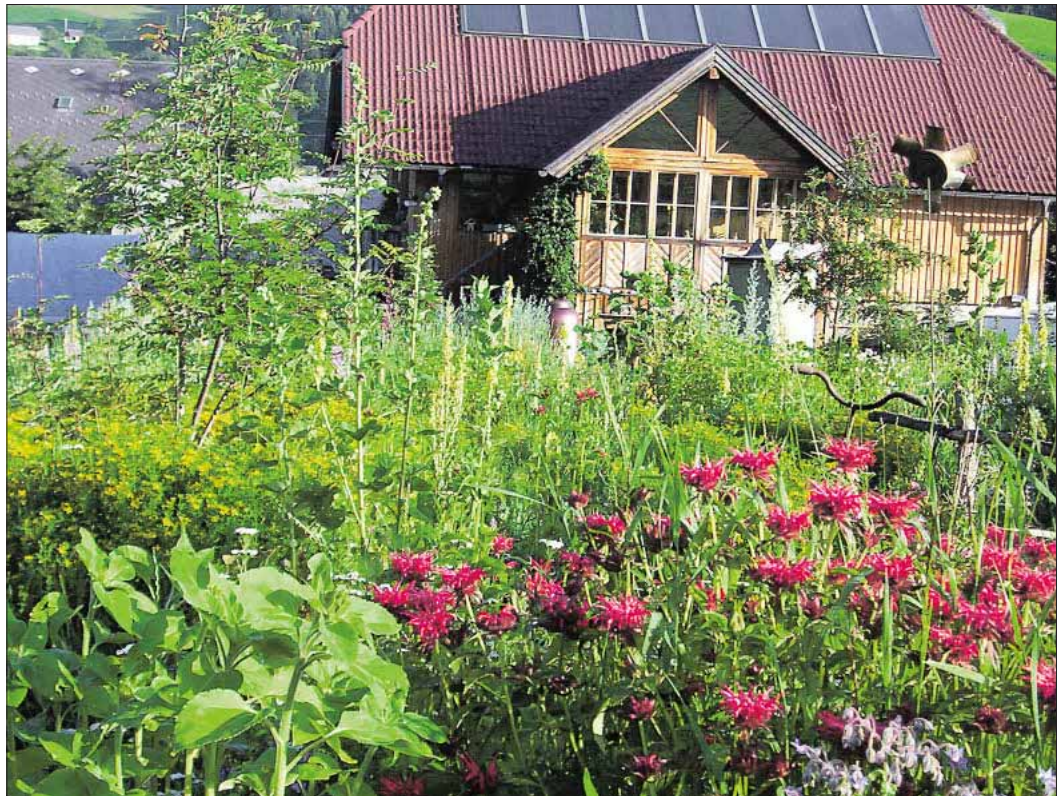
Ein Blick in den Kräutergarten beim Trimmingerhof in Sauerfeld.

Aber auch für das Brauchtum haben Kräuter im Lungau eine große Bedeutung – über den Lungau hinaus bekannt sind die Prangstangen in den Gemeinden Zederhaus und Muhr. Tausende