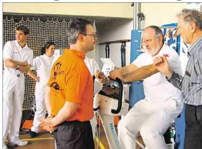
Sehr gut angenommen wird das Turn- und Bewegungsprogramm.

Besonders beliebt sind Kochkurse für gesunde Ernährung, die bei einem gemeinsamen Es-