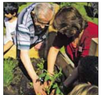
Gemeinsam geht's besser.