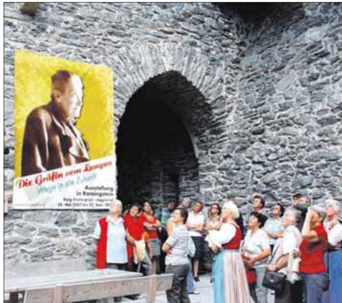
Die Ausstellung ist noch bis 22. September geöffnet.

Interessant ist sicherlich der Pauschalpreis: Egal, von welcher Gemeinde des Landes die Reise in den Lungau angetreten wird, sind mit € 9,50 pro Kind der Bus-transfer hin und zurück sowie der Eintritt abgedeckt. Die gesamte Organisation übernimmt