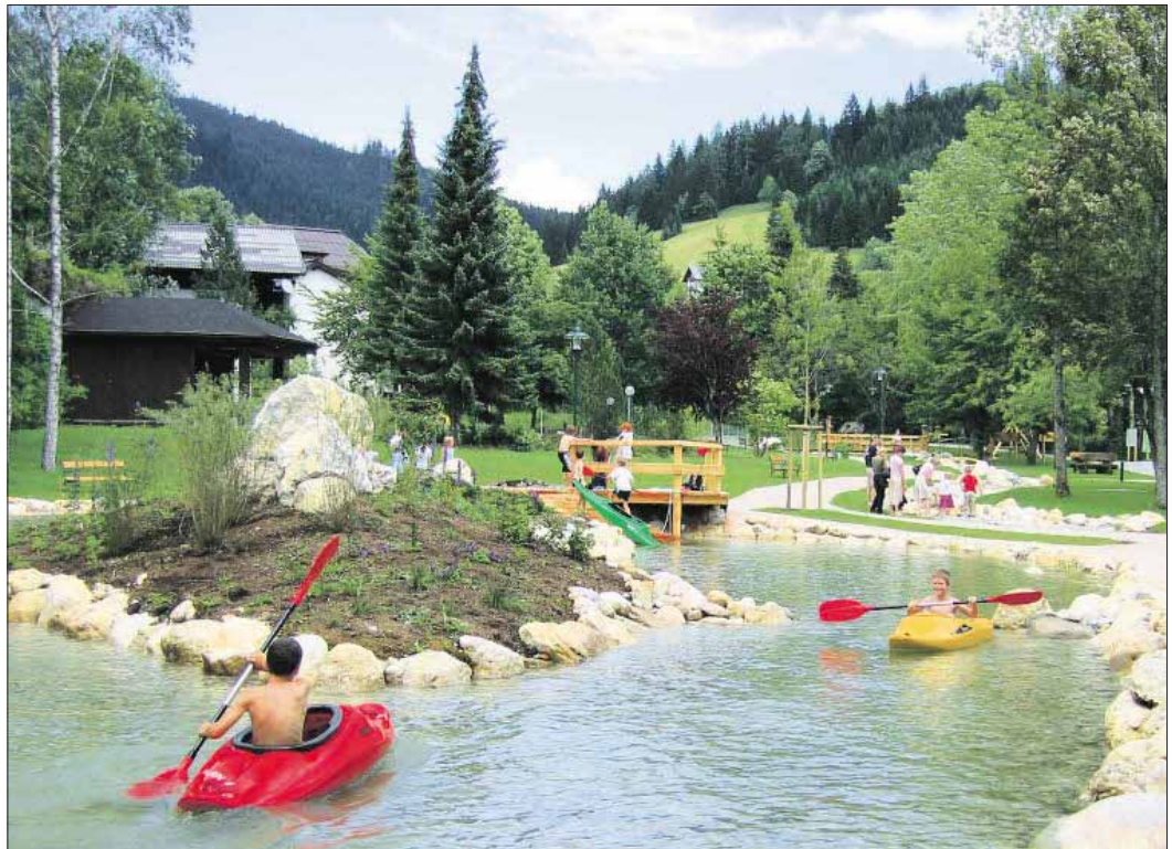
Die „Kinder-Kanu-Strecke“ – ein Highlight des Rußbacher Wasserparks.

Für die Badebegeisterten steht nun ein Naturschwimmbad mit beeindruckendem Wasserfall, diversen Sprungmöglichkeiten