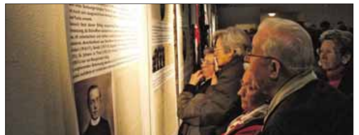
Das „Thalgauer Bedenkjahr 2008“ sorgt für Diskussionsstoff.