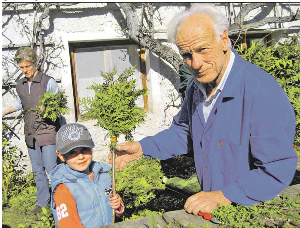
Generationenverbindend ist das jährliche Palmbuschenbinden, das vom Obst- und Gartenbauverein organisiert wird.

Nach Sozialzeitausweis (2006) und Sozialzeitkonto (2007) wurde vor kurzem die Sozialzeitbilanz präsentiert. Mit diesen drei Bonusmodellen soll persönlicher Einsatz im Bereich des Zusammenlebens der Generationen vermehrt anerkannt und gewürdigt werden. Dabei geht es um jene, oft für selbstverständlich genommenen Tätigkeiten, die erst wahrgenommen werden, wenn sie längere Zeit nicht mehr geschehen. Vermehrte Beachtung finden die vielfältigen Formen von Unterstützung und Hil-