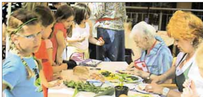
Seniorenwohnheime werden zu Begegnungszentren.

Albertus-Magnus-Haus, ebenfalls ein Altenheim des Stadtteils, wird Ende Mai ein Spielplatz eröffnet. Diesen und anderen Aktionen ist es zu verdanken, dass die Seniorenwohneime immer mehr zu Begegnungszentren werden. Auch der Austausch zwischen Jung und Alt ist garantiert. Jüngstes Beispiel: ein Spielenachmittag in der Seniorenpension am Schlossberg.