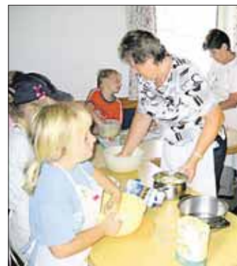
Bürgerengagement schafft Lebendigkeit und Freude am Gemeinwesen.

Was bringt freiwilliges soziales Engagement? Bürgerengagement schafft Lebendigkeit und Freude am Gemeinwesen, bietet Möglichkeiten zur Selbstverwirklichung und Sinnfindung. Die Gemeinde ist auf ein lebendiges Miteinander angewiesen, Bürgerengagement wird auch als Standortfaktor bewertet, und Bürgerengagement ist gelebte Demokratie. Elixhausen hat die Weichen dafür bereits gestellt!