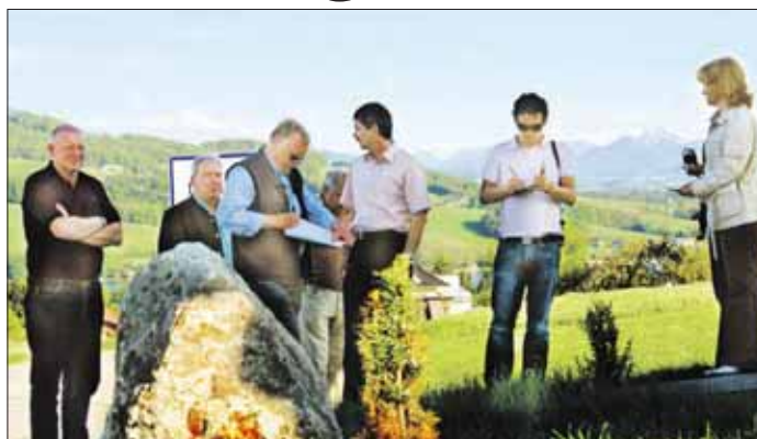
Anfang Mai hat die fachkundige Jury mit Experten aus Bayern, der Slowakei und Tirol die Gemeinde genau unter die Lupe genommen.

T he Winner is – das wird es zwar erst im Juli 2008 heißen, aber der Startschuss zum Wettbewerb um den Europäischen Dorferneuerungspreis 2008 ist gefallen. 29 Teilnehmer – Gemeinden und Regionen – aus 12 Nationen sind im Rennen um diese begehrte Auszeichnung, die seit 1990 alle zwei Jahre von der Europäischen ARGE Land-