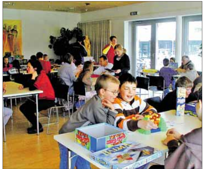
Der 2. Spielenachmittag im Generationendorf Elsbethen war ein voller Erfolg.

Ein (Vor)Ausblick auf die kommenden Generationendorf-Aktivitäten zeigt eine bunte Palette an Angeboten: ein „Tag der Begegnung“ im Seniorenwohn-