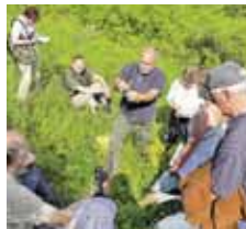
Ab Oktober: Nachhaltigkeits-Intensivlehrgang.

Der Nachhaltigkeits-Intensivlehrgang richtet sich an Personen die idealerweise bereits Projektideen und -konzepte mitbringen. Diese Ideen und Konzepte werden seminarbegleitend zu konkreten Projekten weiterentwickelt.