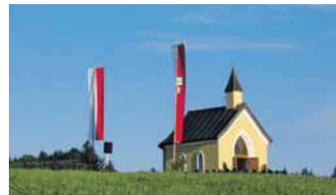
Bild links: Von der Kameradschaft Seeham wurde mit Unterstützung von Firmen und Sponsoren 2005 eine Friedenskapelle errichtet. Bild rechts: das Kriegerdenkmal in Seeham.