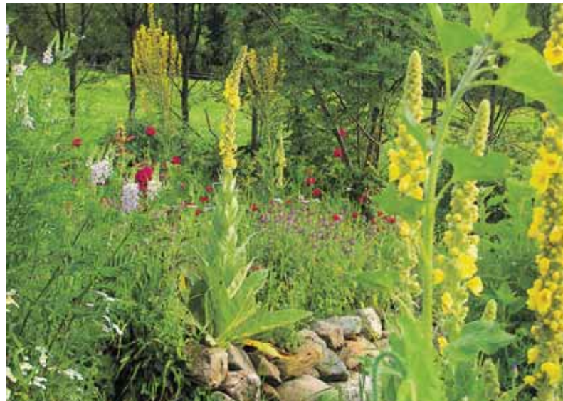
Kräutergarten am Trimmingerhof in Sauerfeld, Tamsweg

Broschüre. Für den Sommer 2009 ist es gelungen, alle Programmangebote der Kräuterinitiative Lungau in eine Broschüre zusammenzufassen – von den Kräuterführungen und der Lungauer Bergwelt bis hin zu kulinarischen Kräuter-Genüssen in Lungauer Gasthöfen.