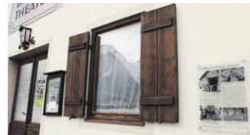
Zwei beispielhafte Tafeln sind bereits im Markt Lofer zu bewundern – am Gemeindeamt sowie am alten Theater.

Die Arbeit geht nun in die Finalisierungsphase. Im Herbst ist eine Ausstellung und Veranstaltung mit der Bevölkerung geplant, damit Anregungen noch Berücksichtigung finden können, bevor alle rund 50 Tafeln fertig gestellt werden.