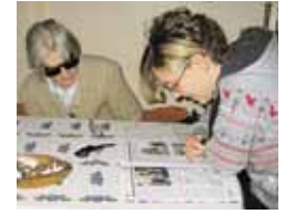
Generationendorf Elixhausen: Vorlesen aus der Gemeindevorlesung in Elixhausen zum geliebten Miteinander von Jung und Alt.

Seit 2003 bilden die Generationendorf-Aktivitäten in Elixhausen eine tragende Säule des sozialen Zusammenlebens in der Gemeinde. Diese Aktivitäten werden seither kontinuierlich fortgeführt und ausgebaut. Eine dieser Aktivitäten ist das Projekt „Sozialzeitbilanz“, die heuer, nach 2007, für das Jahr 2008 bereits zum zweiten Mal „gezogen“ wurde.