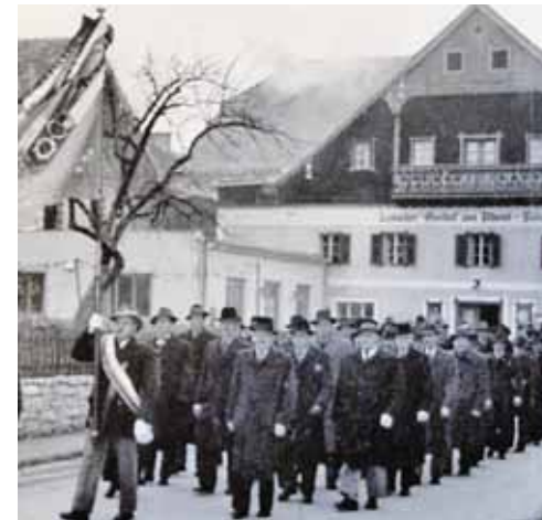
Seeham setzt sich mit seiner Vergangenheit auseinander.

A m Beginn des erfolgreichen Zeitzeugenprojekts stand in Seeham der Wunsch, Vergangenes vor dem Vergessen zu bewahren. Während der Erhebung zum Kulturkatalog sowie der Beteiligung Seehams an einem EU-Alpenraumprojekt zur „Wiederbelebung alter Handwerkstechniken“ in Zusammenarbeit mit der Gemeindeentwicklung Salzburg wurde deutlich, dass die älteren Bewohner der Gemeinde noch viele interessante Dinge berichten können. Diese würden,