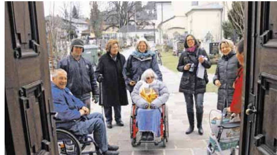
In der Modellgemeinde Mattsee wurden vor Kurzem gemeinsam mögliche Barrieren für ältere Mitmenschen gesichtet.

zierte Bankomaten, enge Eingänge, fehlende Lifte: Nicht für alle gestaltet sich das Alltagsleben barrierefrei! Menschen mit Behinderungen und auch ältere Menschen stoßen bei solchen Lebensrealitäten häufig an ihre Grenzen. Deshalb findet im Rahmen von „Altern in guter Gesellschaft“ in Zusammenarbeit mit dem Zentrum für Generationen und Barrierefreiheit eine Begehung und Sichtung der Modellgemeinden statt. Es wird dabei auf angeleitete Selbsterfahrung gesetzt. Die Perspektiven ändern sich! Durch Bewusstseinsbildung und Sensibilisierung wird auf die Barrieren in den Gemeinden aufmerksam gemacht.