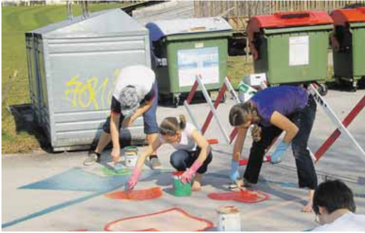
Die Malaktion beim Buswendekreis vor dem Kindergarten war ein voller Erfolg.