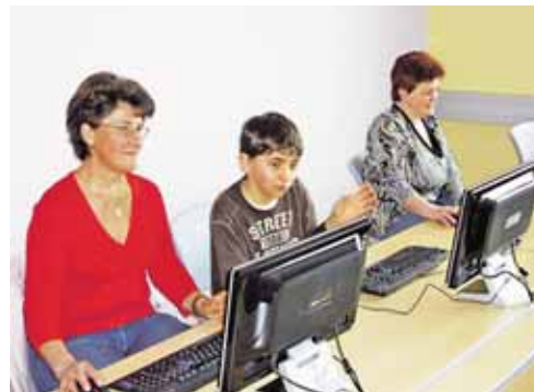
In der Modellgemeinde Seeham surfen Firmlinge mit Seniorinnen im World Wide Web.

Hohe Gehsteigkanten, fehlende Abfahrtsrampen, nicht mit Farbstreifen markierte Stiegenauf- und -abgänge, zu hoch plat-