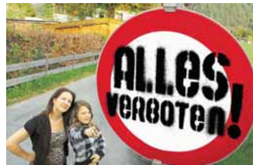
„Alles verboten!“ – Die Gemeindeentwicklung Salzburg startet zum brisanten Thema „Nutzungskonflikte im öffentlichen Raum in Stadt und Land Salzburg“ einen Schwerpunkt.

Darüber hinaus ist jede und jeder von uns anders in den Augen der anderen! Warum ruft Anderssein Angst hervor? Welche Möglichkeiten gibt es, mit der Angst vor den anderen umzugehen?