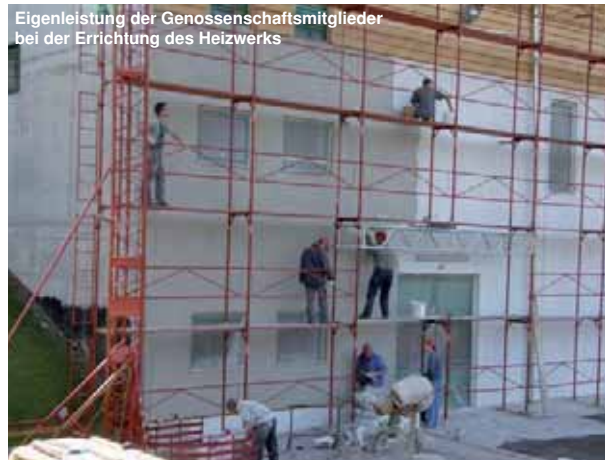
Eigenleistung der Genossenschaftsmitglieder bei der Errichtung des Heizwerks