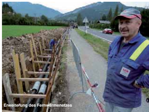
Erweiterung des Fernwärmenetzes