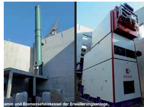
amin und Biomasseheizkessel der Erweiterungsanlage