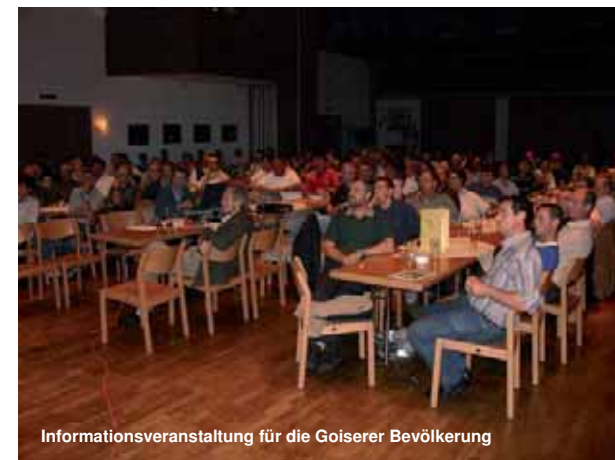
Informationsveranstaltung für die Goiserer Bevölkerung