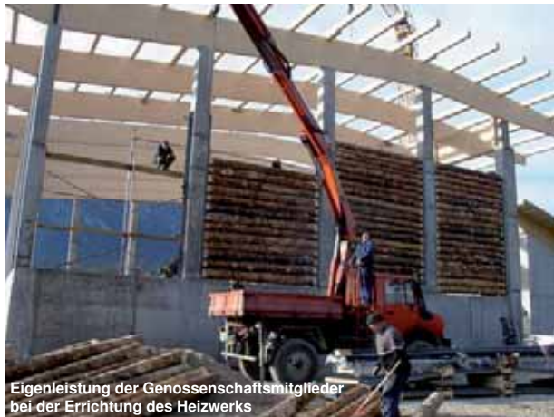
Eigenleistung der Genossenschaftsmitglieder bei der Errichtung des Heizwerks