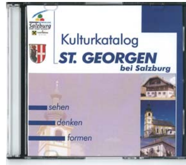
Der Inhalt des Kulturkataloges liegt auch in Form einer DVD vor